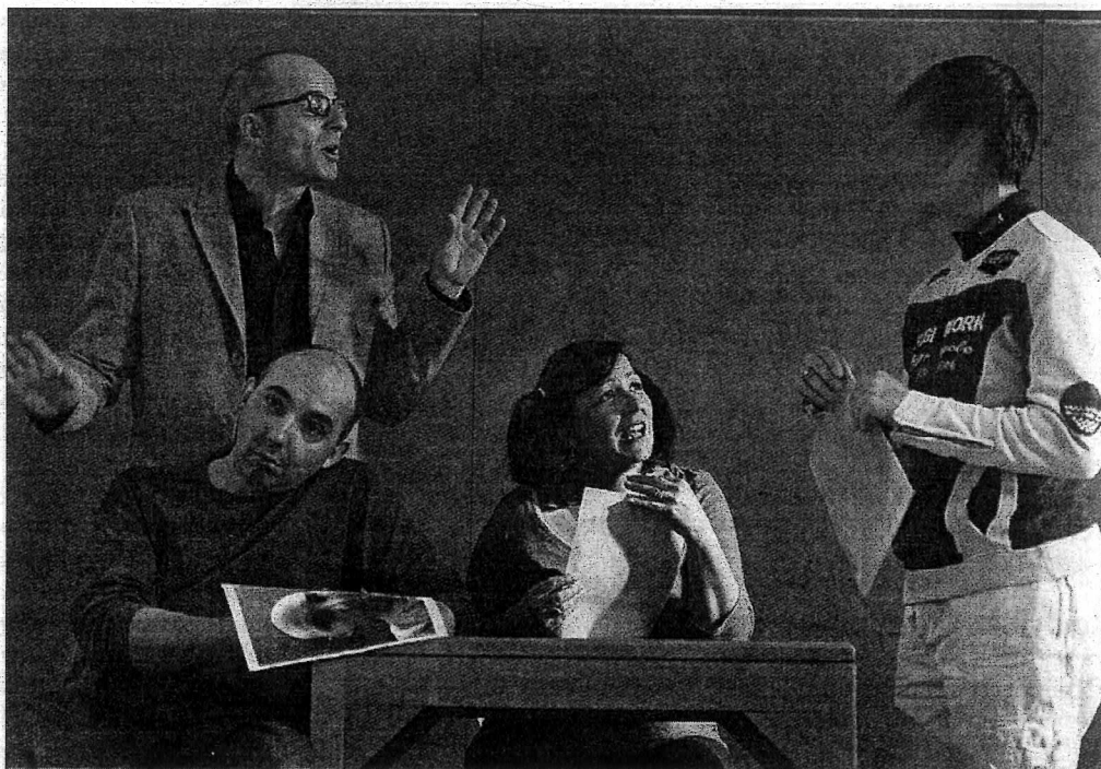
Les résidents sont montés sur scène afin d'apporter leur propre point de vue.